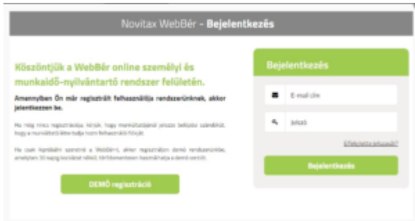
WebBér indítási képernyő felhasználói bejelentkezés

Ha a művelet sikerült, akkor megjelenik az alábbi üzenet és Önnek a használat megkezdéséhez újra kell indítania a BÉR programot.